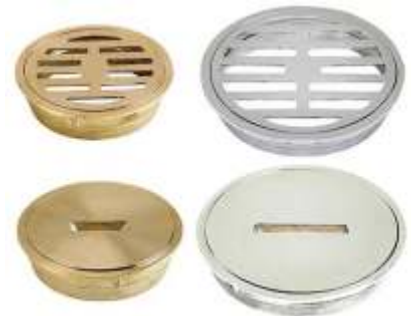
REGISTROS Y SUMIDEROS