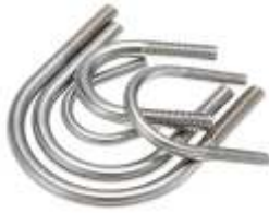
ABRAZADERA U - BOLTS