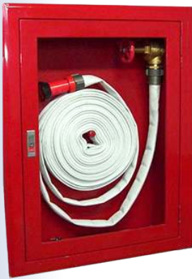
GABINETES CONTRA INCENDIO