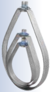
COLGADOR TIPO GOTA