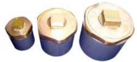
REGISTROS TIPO DADO